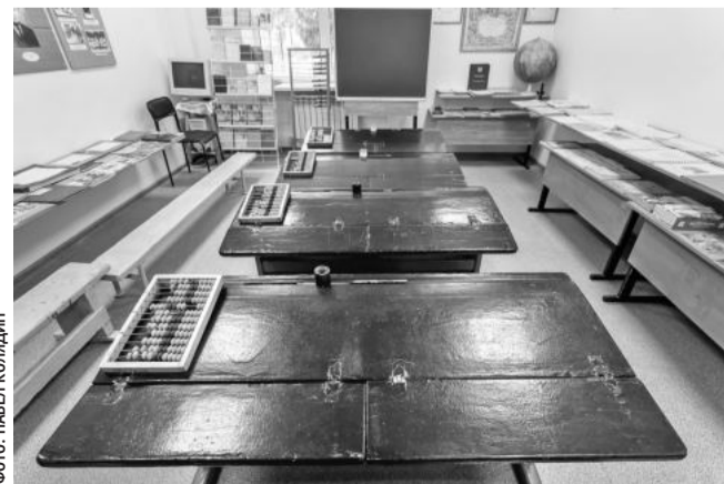
Зал истории образования в музее Томаровской школы № 1

С тех пор все уроки русского языка, литературы и беседы о советском обществе проходили без курьёзов. Молодёнская учительница даже съездила в областное управление кинофикации. Договорилась каждую неделю по пятницам привозить в колонию фильмы.