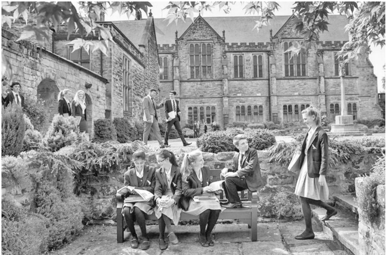
В некоторых канадских школах от формы и не думали отказываться