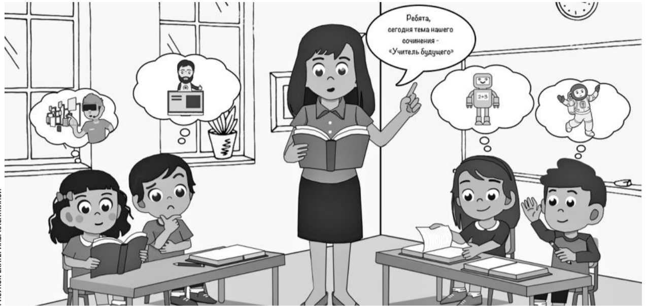
РИСУНОК ЕКАТЕРИНЫ КАСАКИНОЙ

Общая сумма выделенных средств — 10 млн рублей. Из них федеральное финансирование — около 8,5 млн. Почти 1,4 млн —