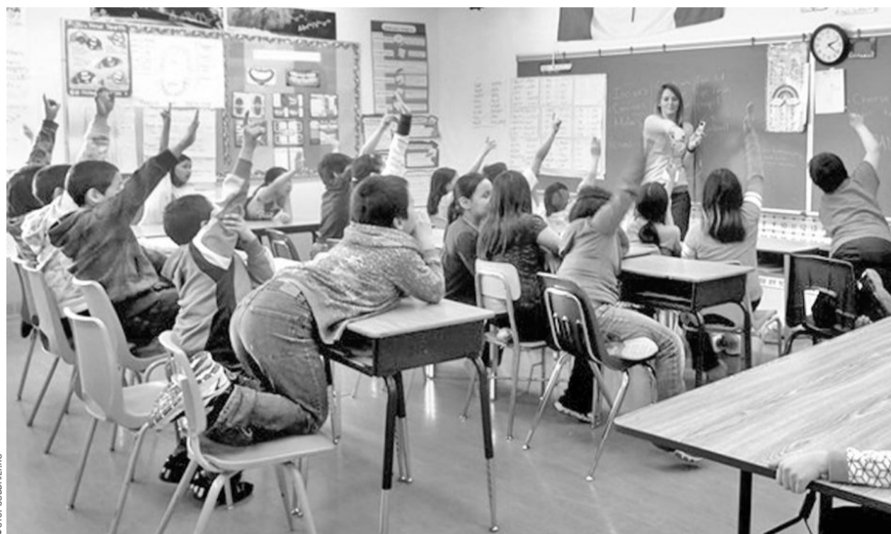
Занятия в одной из канадских школ