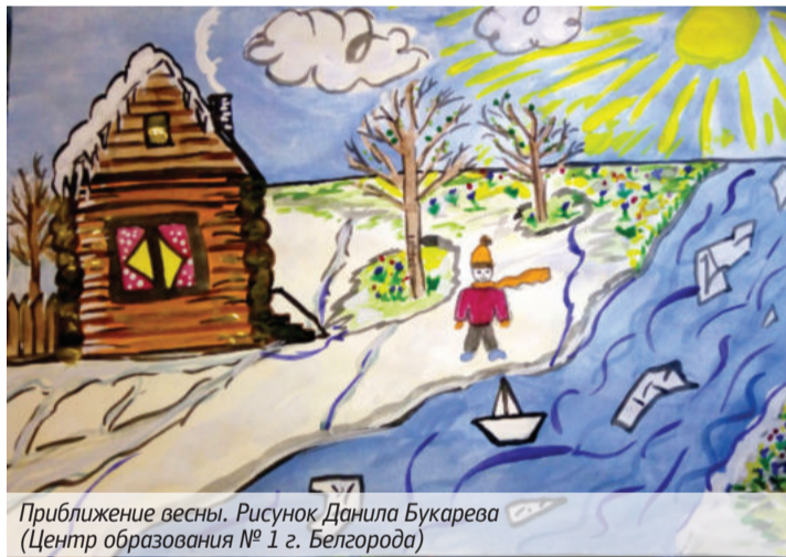
Приближение весны. Рисунок Даниила Букарева (Центр образования № 1 г. Белгорода)