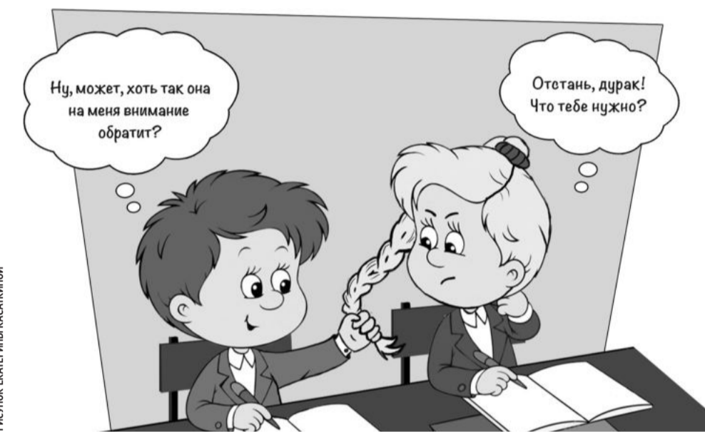
РИСУНОК ЕКАТЕРИНЫ КАСАКИНОЙ

Наши подростки переживают чувства влюблённости, первой любви, дружбы — это прекрасные человеческие чувства и отношения,