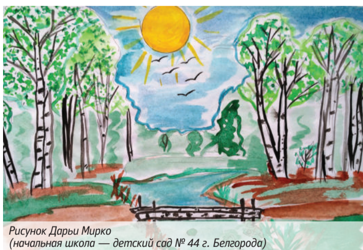
Рисунок Дарьи Мирко (начальная школа — детский сад № 44 г. Белгорода)