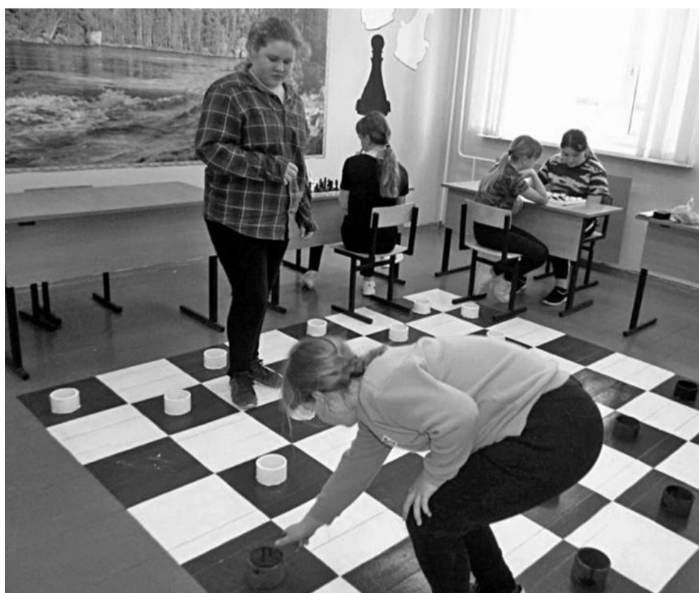
Игровая зона в Глинской школе