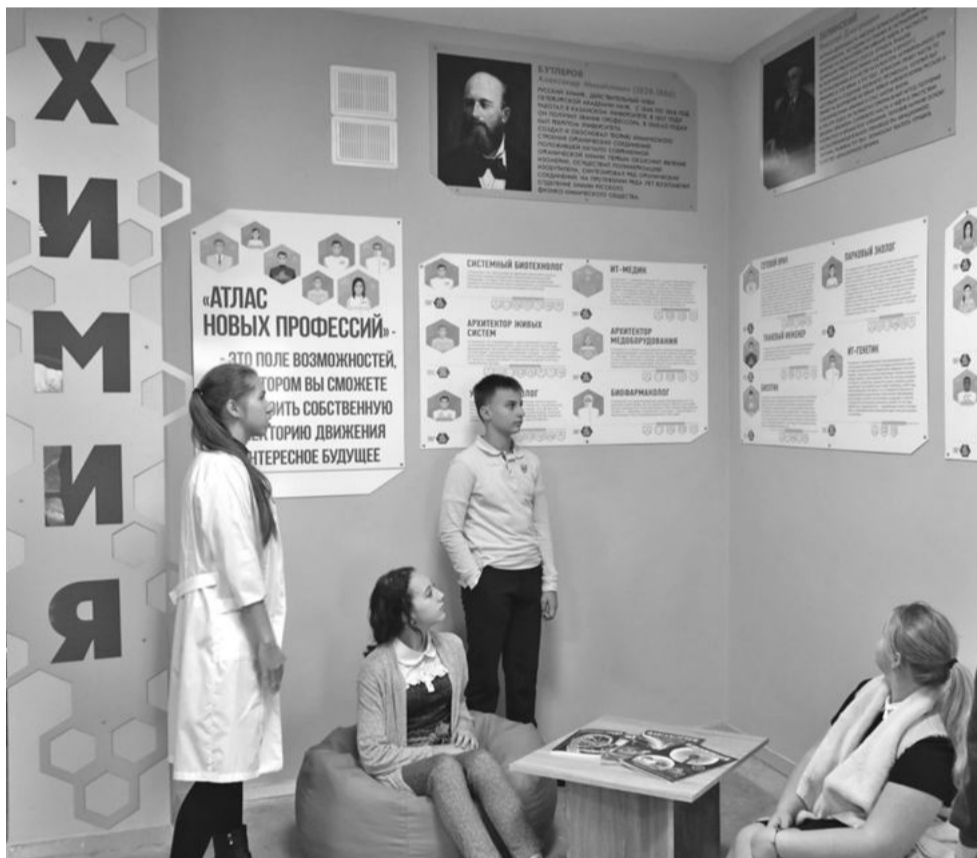
Профориентационная зона в школе № 1