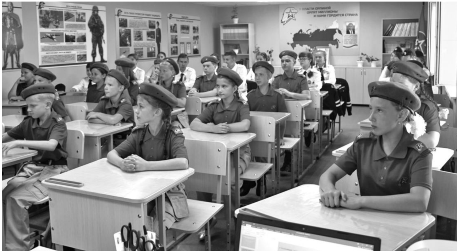
Кадетский класс школы № 1

В результате реализации проекта в школе создали лабораторию, которую можно без преувеличения назвать кузницей пытливых, талантливых юных исследователей. Ученики от четвёртого до выпускного классов занимаются наукой. В рамках постпроектной деятельности рядом с лабораторией оформлена развивающая зона «Химия занимательная и увлекательная», которая рассказывает об опытах,