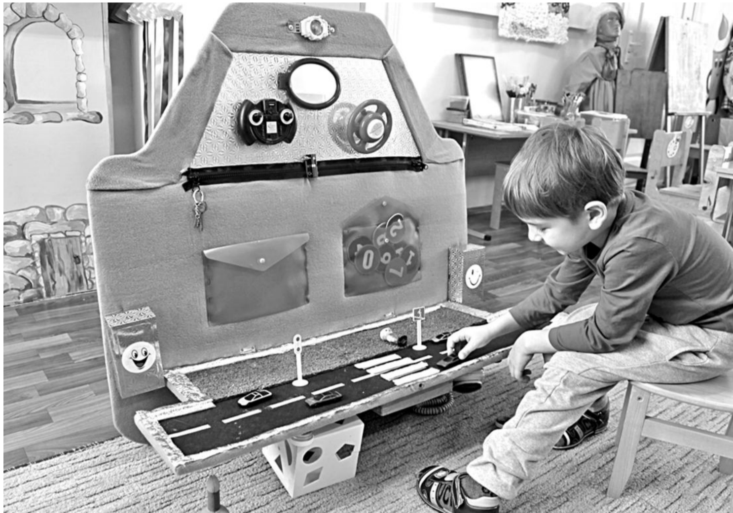
Игровая зона в детском саду № 8

СЕГОДНЯ СВОИМ ОПЫТОМ ДЕЛЯТСЯ УЧРЕЖДЕНИЯ ОБРАЗОВАНИЯ НОВООСКОЛЬСКОГО ГОРОДСКОГО ОКРУГА