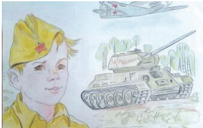
Рисунок Дарьи Лопиной (Корочанская школа им. Д. Кромского)