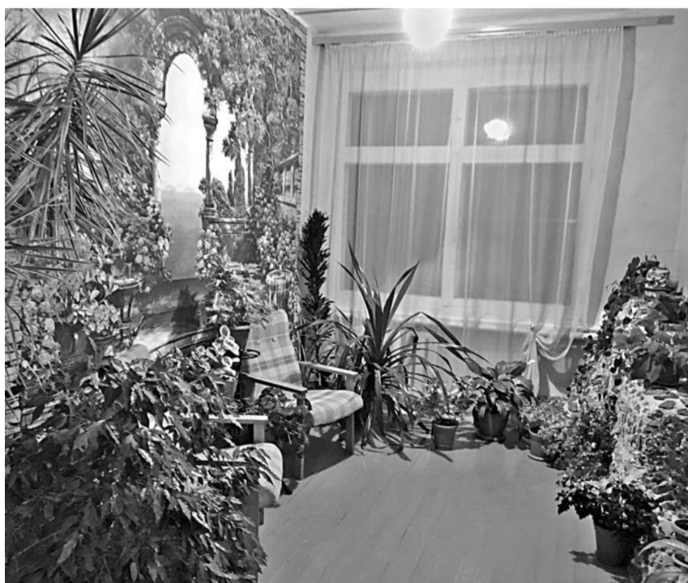
Зимний сад в Васильдольской школе