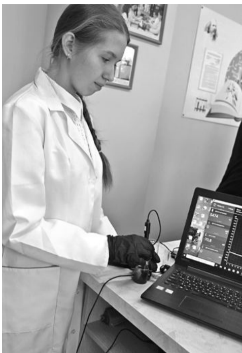
В школе № 1

КОЛЛЕГИ! МЫ ПРИГЛАШАЕМ ВАС СТАТЬ НЕ ТОЛЬКО ЧИТАТЕЛЯМИ, НО И АВТОРАМИ ГАЗЕТЫ!