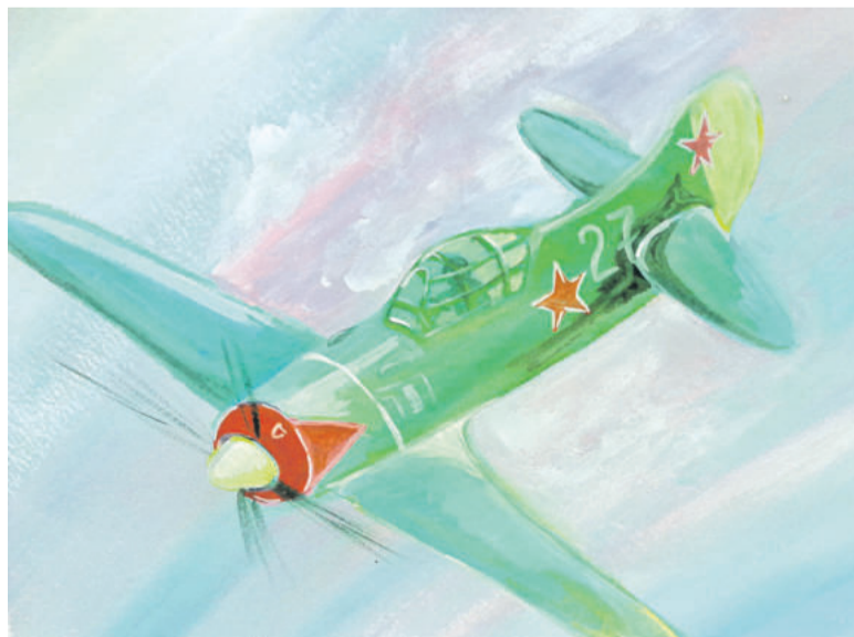
Воздушный бой. Рисунок Дмитрия Новикова (Корочанская школа им. Д. Кромского)