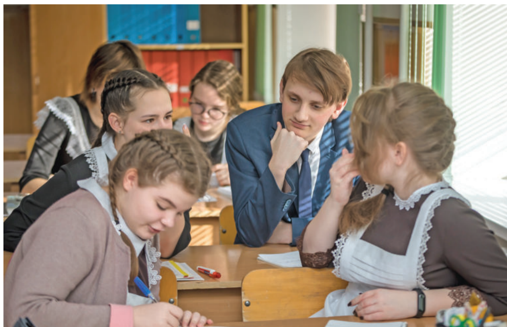
Урок обществознания в 10-м «Б» классе

Ольга МУШТАЕВА » ТЕКСТ, Павел КОЛЯДИН » ФОТО