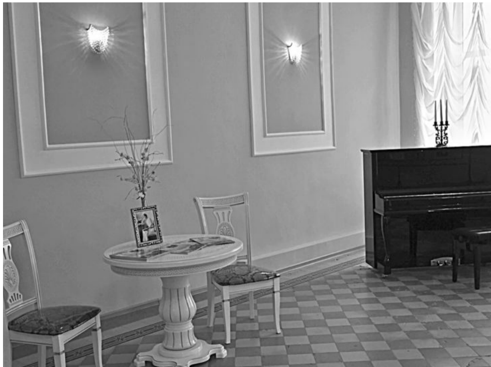
Ольгинский зал школы № 1