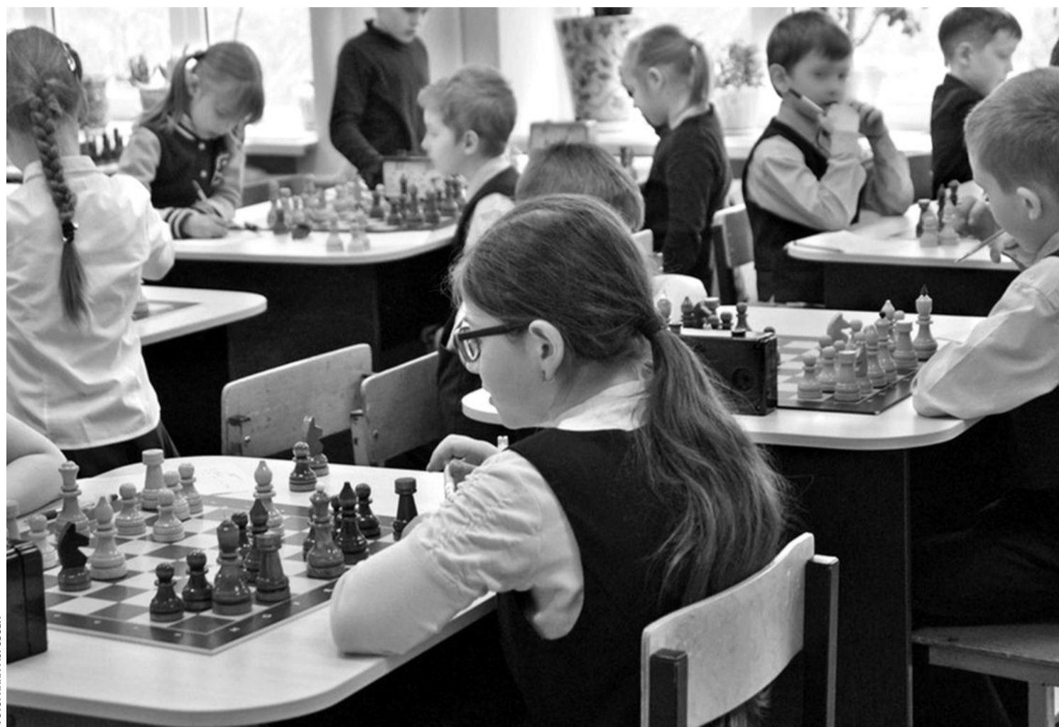
В образовательном комплексе «Луч»

— Высокий уровень локального нормотворчества. В этих учебных заведениях есть хорошо проработанные локальные нормативные акты, которые обрабатывают порядок. Основные образовательные программы и программы развития направлены на активное познание мира, развитие учебно-исследова-