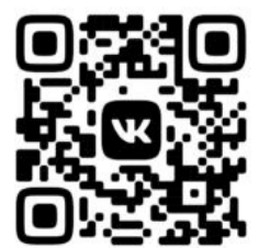
ПАБЛИК В СОЦСЕТИ «ВКОНТАКТЕ» HTTPS://VK.COM/KAFEDRA_DZOT

Созданная группа в соцсети позволит учителям физкультуры оперативно обмениваться лучшими практиками, делиться опытом регионов, конкретных образовательных учреждений.